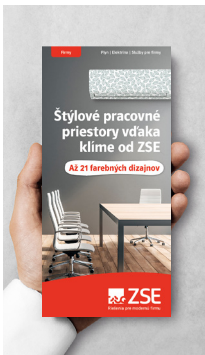
ZSE Klima Dizajn