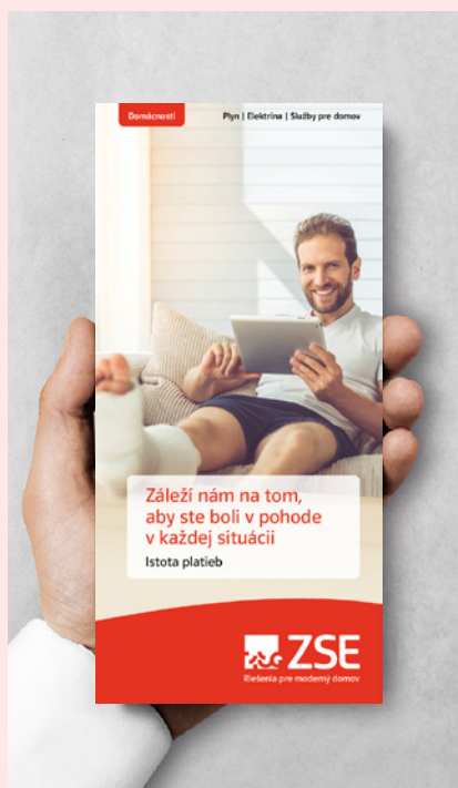
ZSE Istota platieb

prihliadať na udržateľný hospodársky rast a globálnu konkurencieschopnosť a podporovať inovácie a talenty. Preto sa FlexEnergy zameriava na vytvorenie inovačného ekosystému a siete pre ďalšiu spoluprácu.