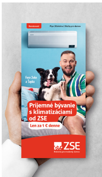
Klimatizácie pre domácnosti

Spoločnosť ZSE Energia, a. s. poskytuje svoje produkty a služby pod značkou ZSE.