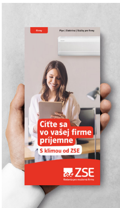
Klimatizácie pre firmy

Poistenie ZSE IT Pomoc pomôže s obnovou dát z pokazeného dátového nosiča, ktorý vyzdvihne kuriér priamo doma, až do výšky 1 500 EUR a až dvakrát ročne, s nárokom na náhradný pamäťový nosič až do 100 EUR. Súčasťou sú tiež konzultácie pri inštalácii softvéru cez vzdialený prístup, či telefonická asistancia pri nastavení mobilného telefónu alebo domácej elektroniky. Výhody poistení ZSE Asistuje Plus, ZSE Zdravie a ZSE IT Pomoc